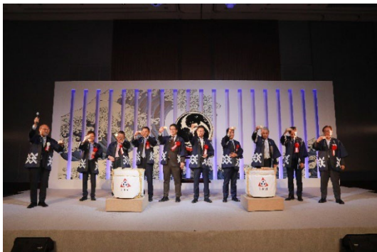
来賓の皆さまとの鏡開き