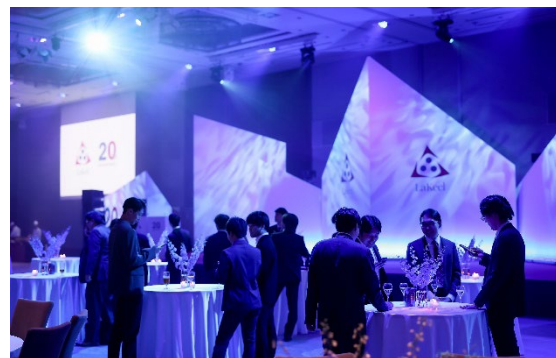
社名に由来のある「船」をモチーフにしたステージ