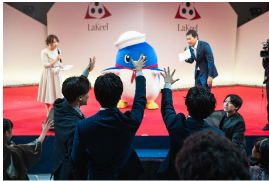
公式キャラクターらきまるとのクイズタイム