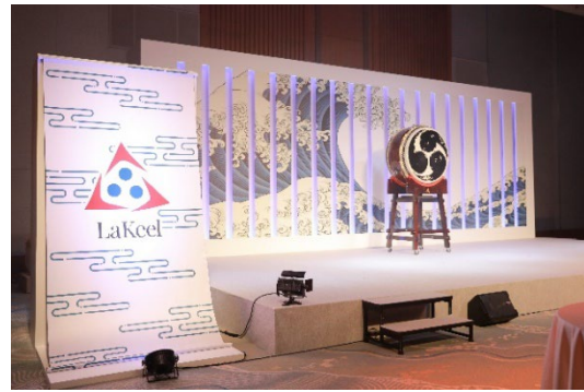
和を基調としたステージ