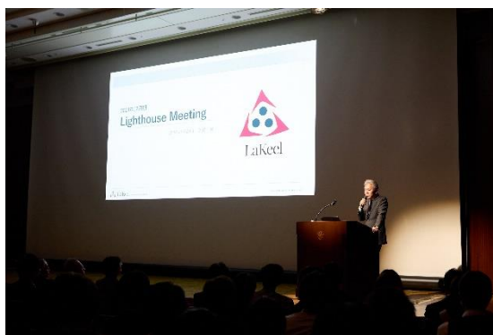
経営陣からの戦略説明