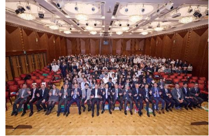
全社員で記念写真